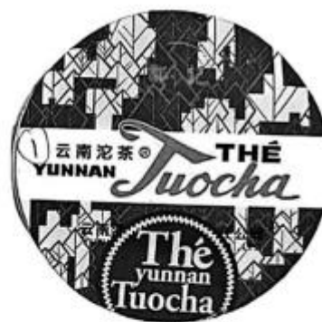
被诉侵权的包装、装潢