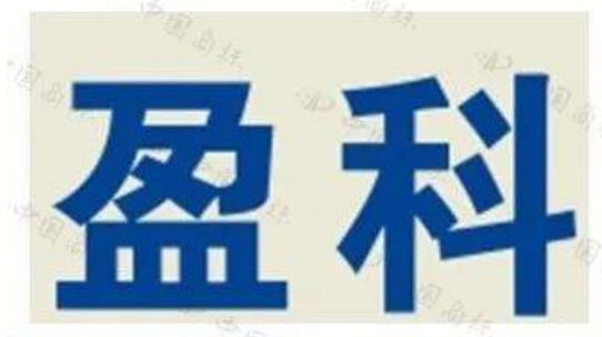
第 13974639 号商标

本案中，盈科公司在其经营的网站、抖音平台等处使用了“盈科法务 Legalpccw”“盈科法务”“盈科法务 YINGKE”“盈科法商学院”作为服务名称，上述标识中的主要识别部分“盈科”与盈科律所经许可使用的第 13974639 号“盈科”注册商标构成近似。涉案被控侵权标识系使用在法律等相关服务上，与第 13974639 号注册商标核准使用的第 45 类诉讼服务等服务项目相同或者类似，极易导致相关公众对服务的来源产生混淆或误认，故盈科公司的上述行为侵犯了第 13974639 号“盈科”商标的注册商标专用权。