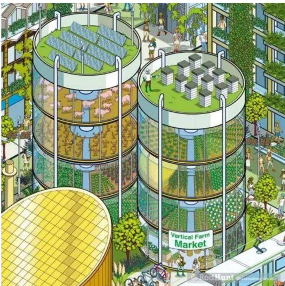
用科技让大楼里就能种菜、养猪养鸡

1、量仔魔法课堂——我对未来城市的期待与想象：导师将引导孩子们围绕身边熟悉的城市景象，用语言描绘出他们对这些景象未来变化的想象。鼓励孩子们打开思路，尽情挥洒灵感，为接下来的搭建环节热身！